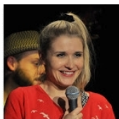
Open Mic POTRVÁ #71 7. 2. 2014