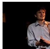
Open Mic POTRVÁ | Ohlédnutí za rokem