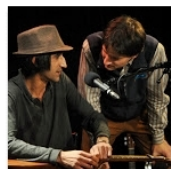
Open Mic POTRVÁ #69 4. 12. 2013