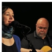
Open Mic POTRVÁ #70 8. 1. 2014