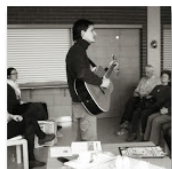
Open Mic & Praha 6 | 2014